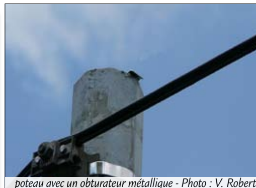
poteau avec un obturateur métallique

Poteau creux obturé par un obturateur plastique (une languette noire sur deux des faces du poteau) : le risque n'est que provisoirement neutralisé car ces obturateurs ont une longévité modérée, cette situation ne doit plus se rencontrer dans les secteurs traités.