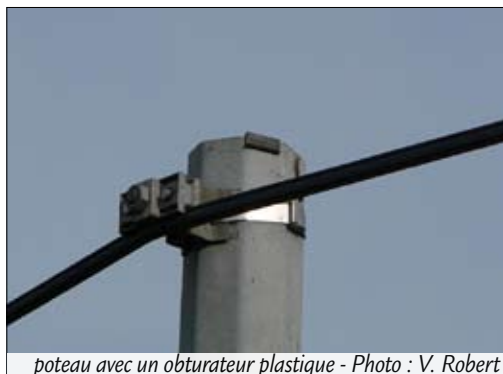
poteau avec un obturateur plastique

Poteau creux obturé par un obturateur plastique (une languette noire sur deux des faces du poteau) : le risque n'est que provisoirement neutralisé car ces obturateurs ont une longévité modérée, cette situation ne doit plus se rencontrer dans les secteurs traités.