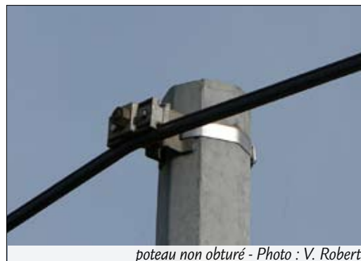
poteau non obturé

Ne négligez aucun poteau. Souvenez-vous que cette action ne bénéficie pas seulement à la chevêche mais à toutes les espèces cavernicoles, (mésanges, sittelles, pics, ainsi que des petits mammifères : écureuils, loirs ...)