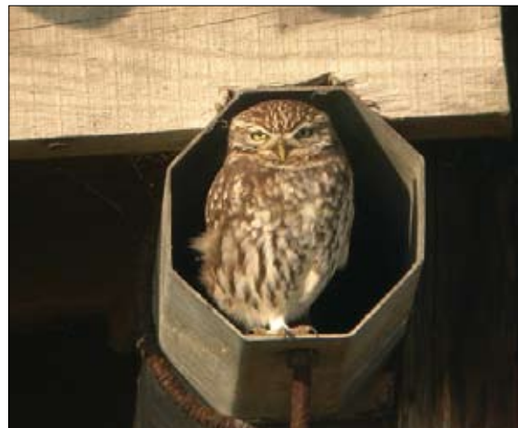
chevêche dans un poteau recyclé en poutre

Une part de la mortalité des chevêches est liée aux installations humaines telles que les poteaux métalliques creux. Poussée par leur instinct cavernicole, les oiseaux se retrouvent piégés dans un puit trop étroit pour qu'ils puissent y déployer leurs ailes et aux parois trop lisses pour s'agripper. Ils s'enfoncent toujours plus dans le poteau et mettent plusieurs jours à mourir. Ce sont ainsi des milliers d'oiseaux, dont beaucoup d'espèces protégées, qui disparaissent chaque année. Ces pièges mortels peuvent être enrayerés simplement par l'obturation de l'orifice.