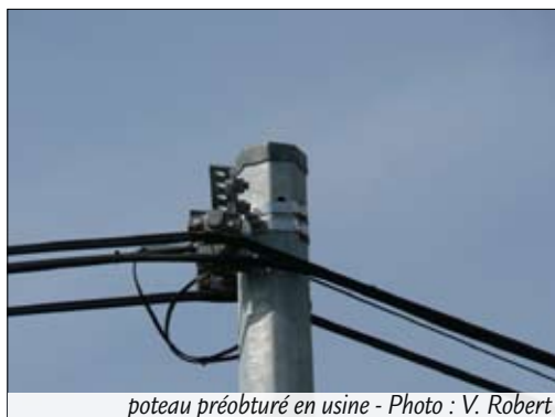
poteau préobturé en usine

Poteau creux obturé par un obturateur métallique (une languette métallique sur deux des faces du poteau) : le risque est neutralisé.