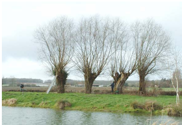
GEC 78-CORIF : conservation de l'habitat de la Chevêche, 25 journées consacrées à la taille des saules en têtards